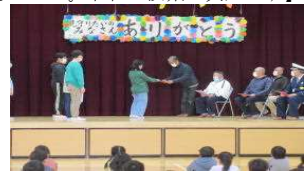
【見守り隊の方いつもありがとう】