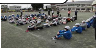
【避難訓練。ルールはみんなを守ります】