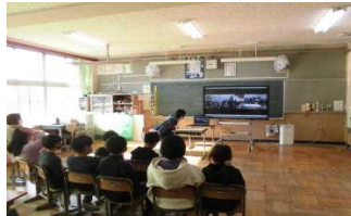
【吟子女史と塙保己一。本庄金屋小と】