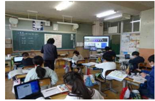
【どの学年もタブレットに慣れてきました。令和の授業…突入です】