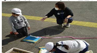
【手作りものさしで外へGO!】