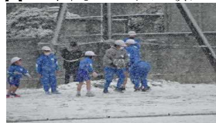
【待望の雪もとてもきれいでした】