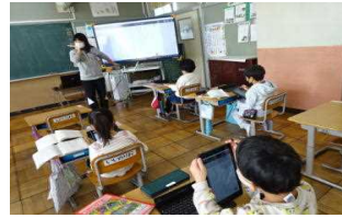
【どの学年もタブレットに慣れてきました。令和の授業…突入です】