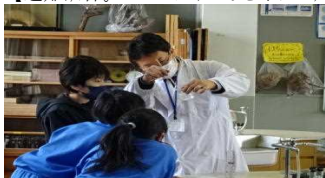
【でんじろう先生?いや教頭先生です】