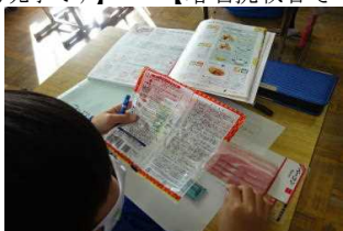
【パソコン見て食品表示を学習中】