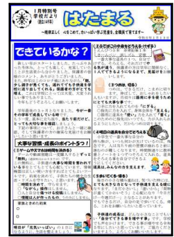
【はたまる1月特別号】

秦小学校では、野菜の収穫、調理員さんの作る温かな給食、高学年と共にする清掃活動、正しい競争を意識した体育授業、気持ちを考えて書く活動等、毎日の学習を通して、そうした「感情(感じること)」を耕す場面を用意します。辞書を引き、見学に出かけて生の声を聞く。うまく行かなくても仲間の応援を力に、勉強や運動に挑戦します。そして天気の良い日は外で思い切り友達と遊ぶ。この 何気ないけれど、とても大事な「経験」 を通して、子供たちの豊かな心を育みたいと考えています。