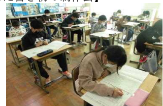
【あきらめない!テストの数々】