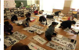
【練習の成果が出せた書き初め制作会】