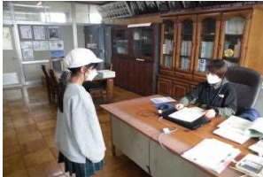
【暗唱挑戦者ぞくぞく】