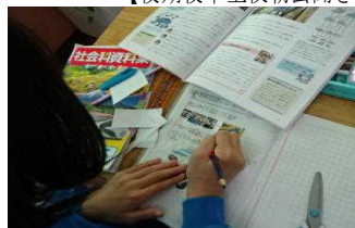
【ノート書き方上達してます】