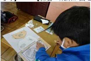
【ありがとうを届けよう給食ポスター】