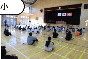
【後期後半全校朝会聞き方見事です】