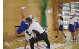
【体育の専門の先生とマット運動】