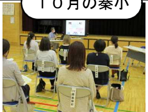
【就学時健診待ってるよ新1年生】