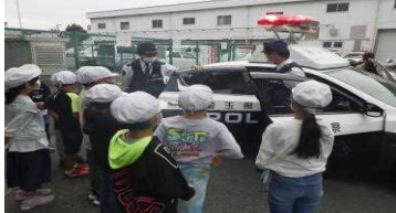
【34年社会科見学警察署ちょっと緊張です】