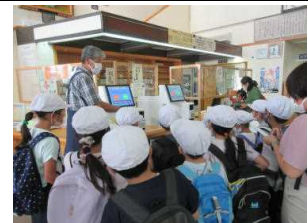
【2年生循環バスで妻沼図書館へ】