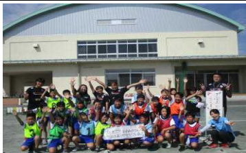
【プロはすごい!アルカスタグラグ教室】