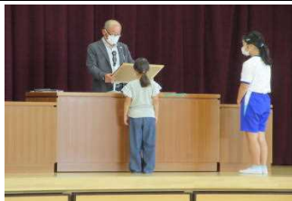
【敬老作文表彰していただきました】